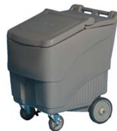
Cubeta con asa BR 80