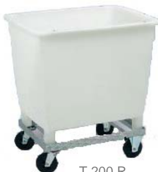
T 200 R